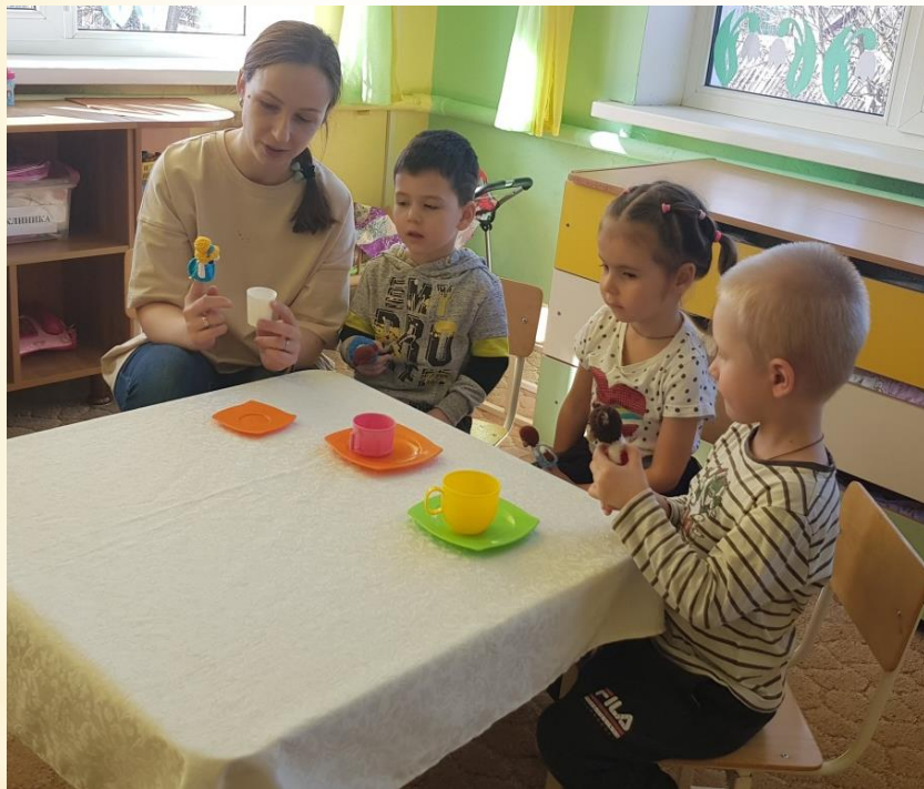
Театрализация «Три Медведя»