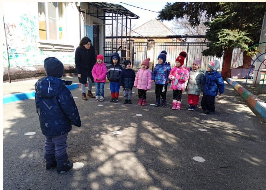
П/И «Если дружно нам живётся»