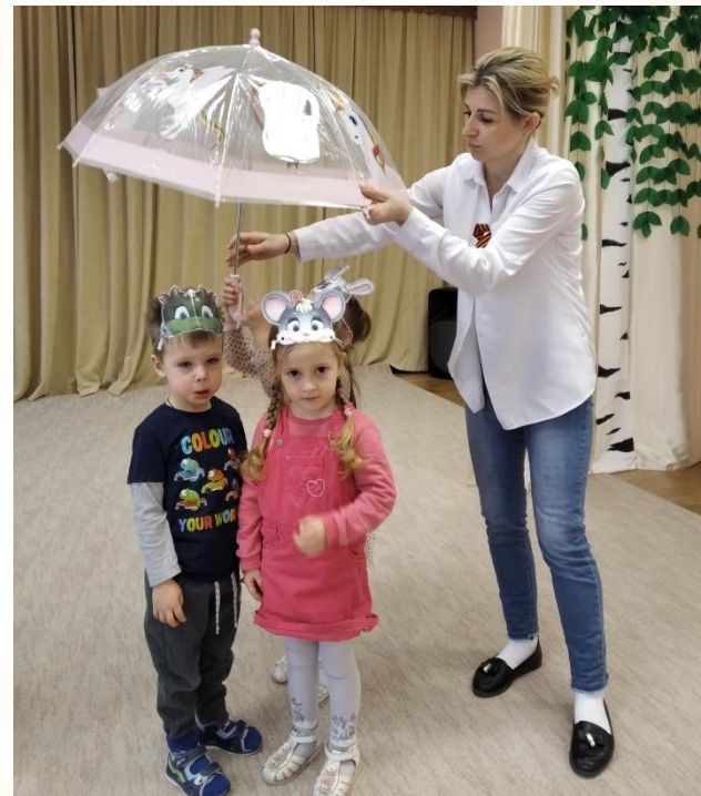
Драматизация «Под грибом»